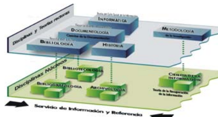
FIG. 2. Modelo de relaciones interdisciplinarias de sistema de conocimientos científicos bibliológico-informativo, según el Dr. Salvador Gorbea .

Gorbea , en cambio, en su tesis doctoral 43 mantiene igual estructura con cambios mínimos en cuanto a las disciplinas rectoras. Donde Setién incluye la comunicación, Gorbea menciona la documentología (teoría del documento). Por otra parte, Gorbea asume como disciplina rectora la informática, mientras Setién la incluye, en sus inicios, como término utilizado por Mijailov y la reconoce como una misma disciplina con dos nombres: informática para los antiguos teóricos soviéticos, y ciencia de la información en el área anglosajona (fig. 2).