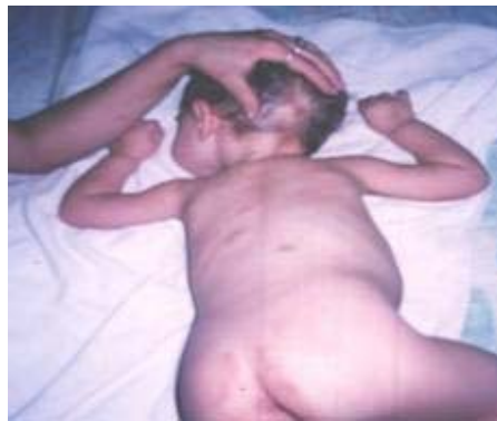
Fig 3. Lesiones en región occipital y cuero cabelludo.

En el interrogatorio no se recogieron antecedentes patológicos familiares, el parto fue eutócico, no se encontraron anomalías del desarrollo físico que no sean las descritas anteriormente. Fue valorada por dermatología y se diagnosticó clínicamente una mastocitosis, los familiares decidieron esperar para realizar biopsia de piel y confirmar el diagnóstico, se le indicó cuidados de la piel, dieta especial y leche de chiva. Los complementarios de rigor fueron normales. La paciente fue dada de alta, con ingreso intradomiciliario y seguimiento por parte del médico general integral, el pediatra y el dermatólogo del área.