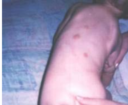
Fig. 2 . Lesiones nodulares en la espalda.