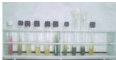
Fig 3. Prueba bioquímica

Actinobacillus actinomycetemcomitans en agar chocolate