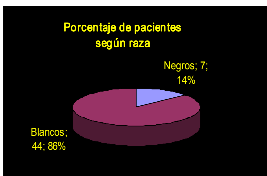
Gráfico 2. Porcentaje de pacientes según raza

Predominó significativamente la raza blanca (44,86%). (Gráfico 2)