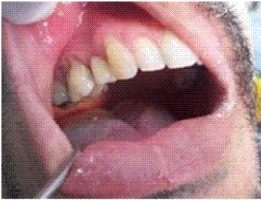
Figura 4. Cementación de la corona en la boca del paciente

Se probó en la boca del paciente donde se chequeó la retención friccional entre la corona y el pilar, la oclusión, contacto gingival e interproximal. Finalmente, se procedió a su cementación con policarboxilato de cinc y se le dio el alta al paciente con magníficos resultados estéticos y funcionales. (Figura 4)