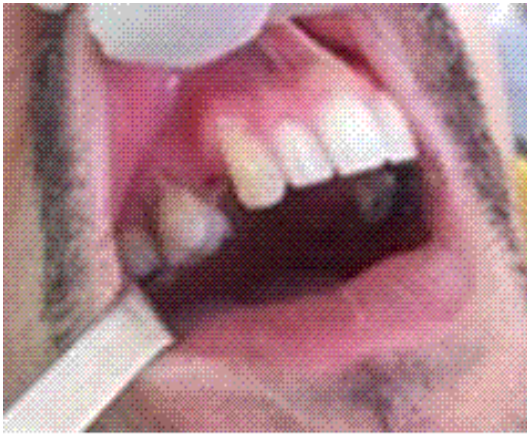
Figura 1. Ausencia del 14

Paciente de 35 años de edad que acude a la consulta de prótesis solicitando la reposición de la primera bicúspide superior derecha (14), lo que le origina una sensible afectación estética y funcional. En el examen clínico participó un equipo multidisciplinario formado por un protesista, un cirujano, un parodontista, un estomatólogo general y un técnico de prótesis. Se apreció en el espacio edéntulo correspondiente al diente ausente que existe suficiente espesor óseo tanto en sentido mesio-distal como vestibulo-lingual y una altura gíngivo-apical aceptable. (Figura 1)