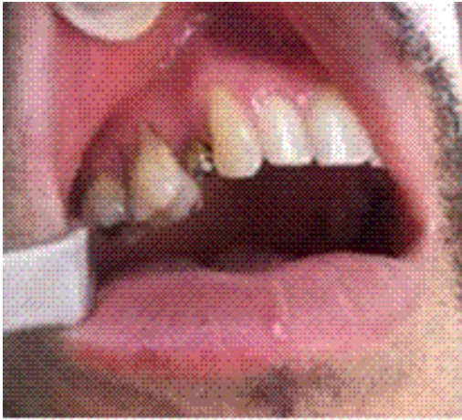
Figura 2. Transfer adaptado

Se talló a las dimensiones y formas descritas anteriormente teniendo en cuenta las características del paciente. Se tomaron impresiones con alginato y registro de mordida en céntrica. Con los modelos obtenidos y montados en un articulador oclusor se confeccionó la corona de acrílico. (Figura 3)