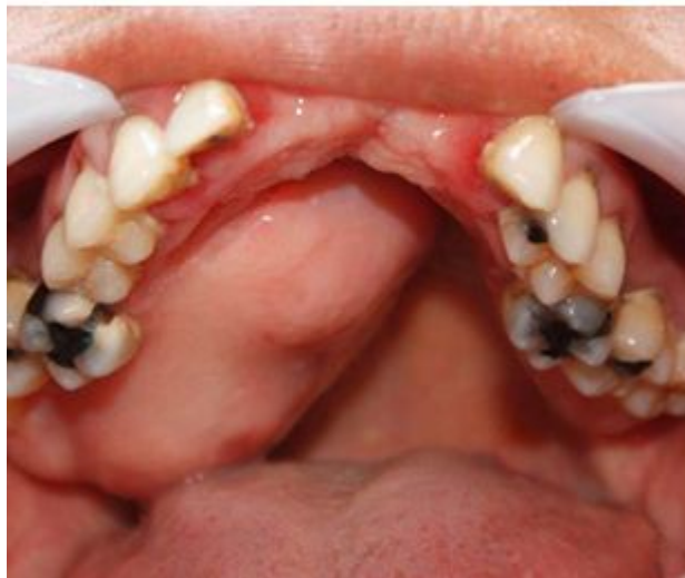
Figura 1. Adenoma pleomórfico en el lado derecho del paladar

Radiográficamente, se observó una zona esclerótica difusa con compromiso de la parte anterior derecha del paladar y que involucró algunos dientes del mismo lado: desde el incisivo lateral hasta el segundo bicúspide. (Figura 2)