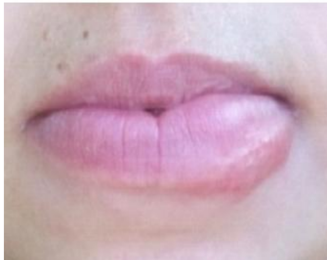
Figura 1. Características en el labio y piel de una lesión granulomatosa en el curso de una Sarcoidosis.

Desde hace más o menos un año comienza a presentar aumento de volumen en el labio inferior que afecta la mucosa y piel de este lugar, el cual está engrosada con signos inflamatorios de consistencia dura, de color grisáceo. La mucosa de esta región es seca, dolorosa, sobre todo cuando se pone en contacto con alimentos calientes. (Figura 1 y 2)