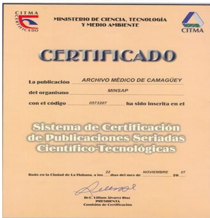
Figura 2. Certificado del CITMA

El 29 de marzo de 2007, se envía carta de solicitud y expediente al presidente de la Comisión de Certificación de la categoría de Publicación Seriadada Científico - Tecnológica del CITMA, la cual es aprobada el 22 de noviembre de 2007, con el código 0573207. (Figura 2)