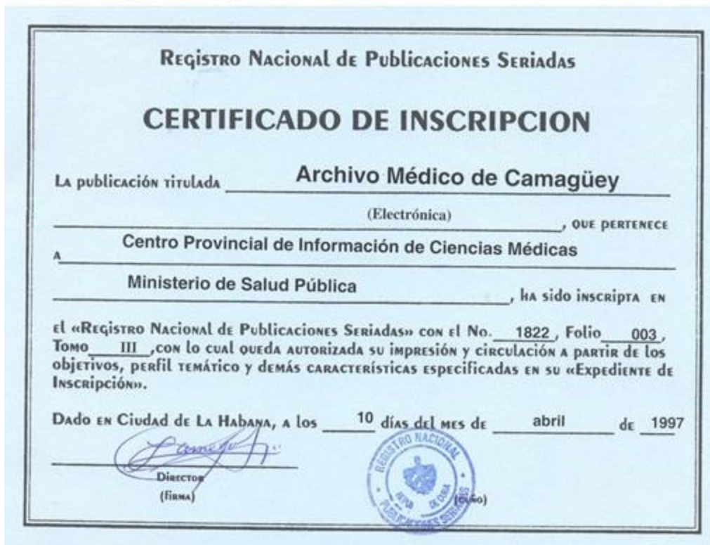
Figura 1. Registro Nacional de Publicaciones Seriadas

Como es de suponer a lo largo de todos estos años, la revista cuenta con un colectivo de trabajo que se puede considerar estable, entre los que se deben mencionar: