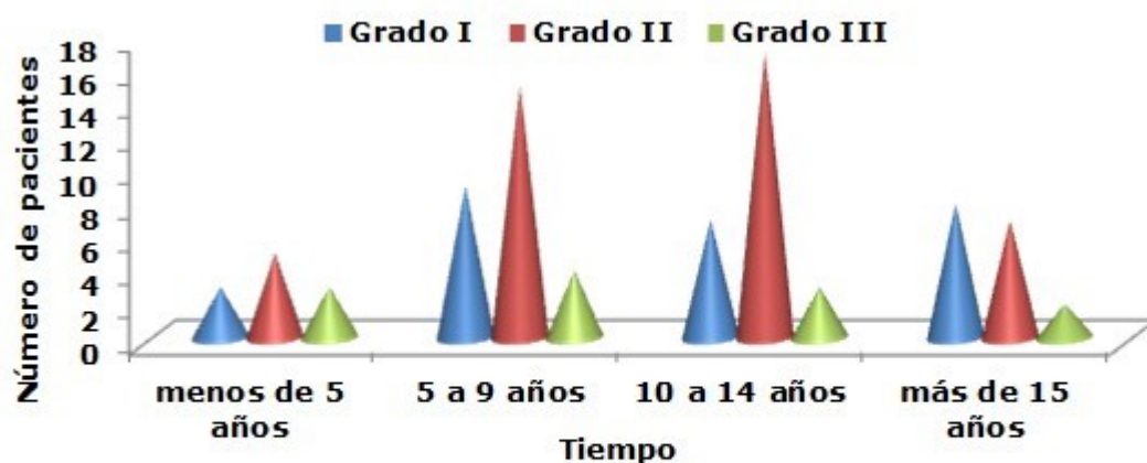
Gráfico 2. Estomatitis subprótesis según grado de lesión y tiempo de construida la prótesis