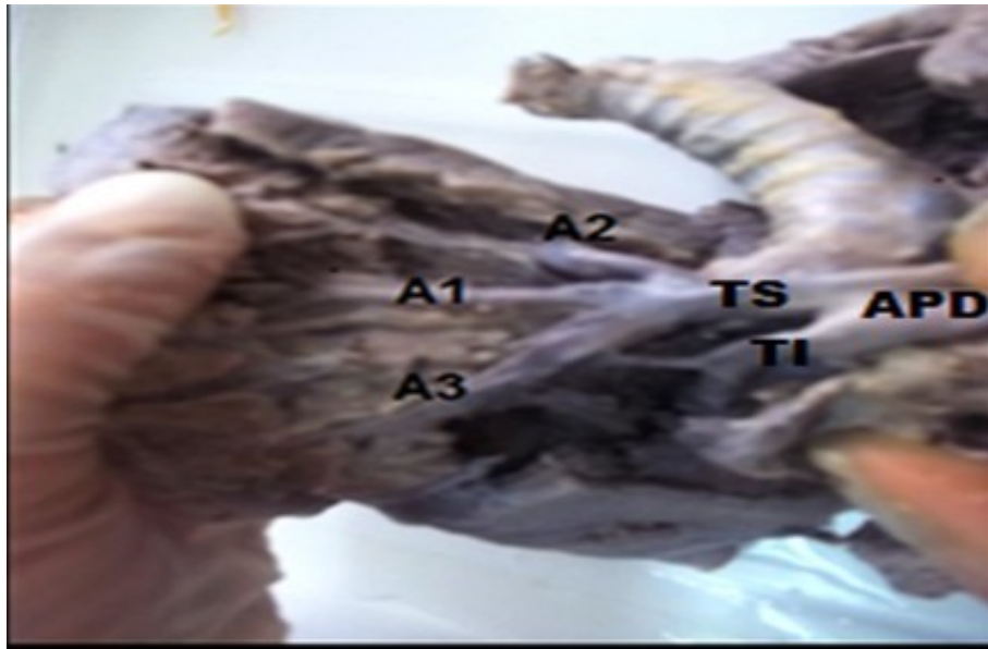
Figura 1. Vista anterior. Tronco superior trifurcado del cual se originan las arterias segmentarias posterior (A2), apical (A1) y la anterior (A3)

APD: arteria pulmonar derecha. TS: tronco superior (trifurcado)