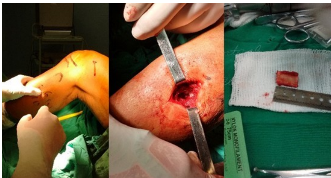
Figura 3. Intervención quirúrgica combinada de artroscopia y osteotomía proximal del peroné en un mismo tiempo quirúrgico y anestésico.