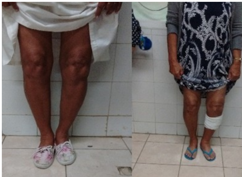
Figura 1. Desviación angular en varo de la rodilla izquierda antes y después de la cirugía.

La evolución posoperatoria de la paciente fue satisfactoria y la marcha comenzó al día siguiente de la cirugía. La enferma refirió alivio del dolor en una escala EVA de tres sobre 10 y flexión de la rodilla de 110 grados.