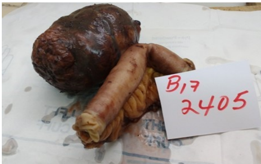
Figura 1. Aspecto macroscópico del tumor extirpado pediculado, ovalado y color pardo oscuro, con número de biopsia B17 2405

En la tomografía axial contrastada se observó presencia de imagen heterogénea, hipodensa de 24 UH de 10x34 cm en la excavación pelviana derecha. Se discute en colectivo, cirujanos y gastroenterólogos, y con diagnóstico de tumor de colon, se decide laparotomía exploratoria, en el acto quirúrgico se encuentra en las últimas asas de yeyuno tumoración de 10 cm, con crecimiento exofítico, se realiza resección intestinal de alrededor de 12 cm y enterorrafia termino terminal, no adenopatías abdominales, ni metástasis hepática. Se realizó amplia toilette de la cavidad peritoneal y el cierre habitual. Se envió la muestra al departamento de Anatomía Patológica (figura 1 y 2).