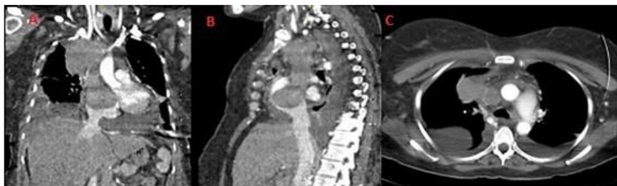
Figura 1. Cortes tomográficos.

de haberle realizado una biopsia por toracoscopia (tumor mesenquimal benigno posible leiomioma de la VCS). Al mejorar su estado se decide seguimiento a los tres meses dada de alta en el mes de noviembre. A finales del mes de marzo del siguiente año reingresa en el hospital con franco choque cardiogénico (signos de taponamiento cardíaco, así como derrame pericárdico y pleural bilateral), se le realizó TAC se observó un crecimiento exagerado de la tumoración inicial, la cual se extendía de manera intraluminal hasta las cavidades derechas del corazón (figura 1).