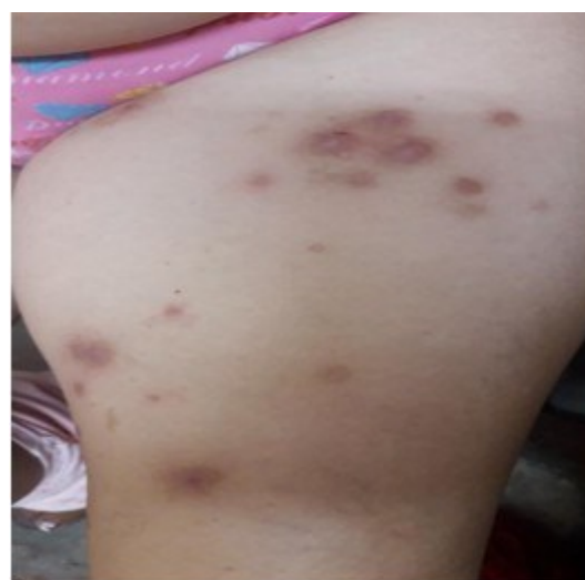
Figura 2. Lesiones autoinflingidas.