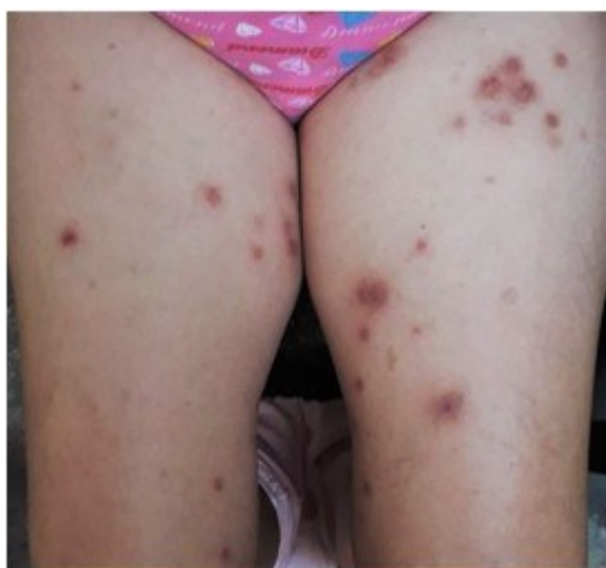
Figura 1. Lesiones autoinflingidas.

Examen dermatológico: cuadro cutáneo con lesiones en placas redondeadas cerca de 1 cm de diámetro, con centro exulcerado con pequeña costra central o como pequeñas placas eritematopar-duscas residuales, en número aproximado de veinte, localizadas en muslos, tronco y brazos (Figura 1 y 2).