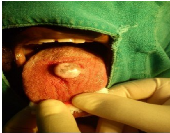
Figura 1. Lesión nodular en la línea media en cara dorsal de la lengua.

Al examen extraoral no se detectaron adenopatías. Al examen intrabucal se observó una masa ovoide en el dorso de la lengua de 3 cm de diámetro de consistencia dura, firme, de color semejante a la lengua, sobrelevada y de bordes bien definidos (Figura 1).