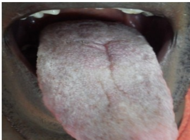
Figura 4. Evolución después de 6 meses, se puede constatar buena cicatrización y ausencia de recidiva.

Los hallazgos resultaron compatibles con tumor de células granulares o tumor de Abrikossoff. El paciente ha tenido seguimiento en consulta y después de seis meses no ha habido recidiva de la lesión (Figura 4).