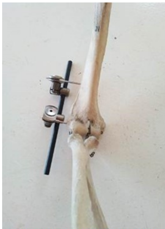
Figura 3 Colocación de fijación externa. Colocación de la barra lateral y los dados.

Cuarto paso: luego del control imagenológico trans-operatorio, se procede a colocar la barra lateral del fijador externo y los dados (Figura 3).