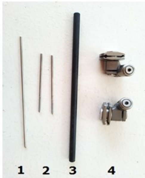
Figura 1 Fijador externo. 1- Alambre de Kirschner, 2- Alambres de 2 mm roscados, 3- Barra lateral, 4- Dados para soporte de barra y alambres roscados.

El fijador externo más empleado es el de barra lateral que también es empleado en pacientes adultos con fracturas del tercio distal del radio. Entre los componentes de este dispositivo se encuentran: alambre de Kirschner, alambres roscados de 2 mm, barra lateral, dados para el soporte de la barra y los alambres roscados (Figura 1). (24,25)