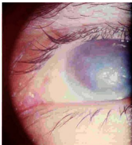
Fig 1. Distrofia o degeneración corneal en celosía tipo I muy avanzada en ojo derecho.

El ojo derecho requirió una queratoplastia perforante en febrero de 2001, quedó pendiente del mismo tratamiento en ojo izquierdo. Este varón tiene siete hijos de dos matrimonios, todos sanos al igual que 12 nietos de los cuales hasta el momento ninguno presenta la enfermedad.