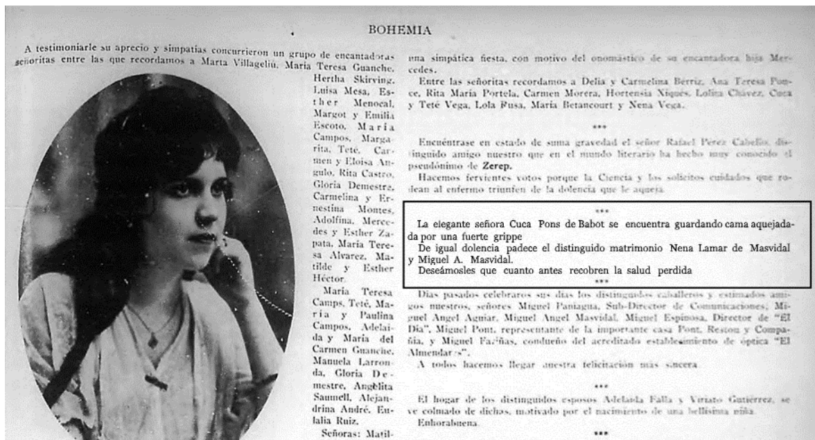
Figura 2. Revista "Bohemia" publicada el 6 de octubre de 1918. Hoja correspondiente a la sección "Sociales" (7)