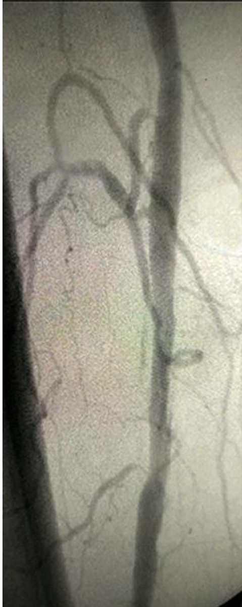
Fig. 3 - Imagen del estudio postangioplastia transluminal percutánea de la arteria femoral superficial (con permeabilización).

Durante el transoperatorio se realizó anticoagulación sistémica del paciente con heparinas no fraccionadas. En el posoperatorio se inició tratamiento con una tableta de aspirina 100 mg y clopidogrel 75 mg al día.