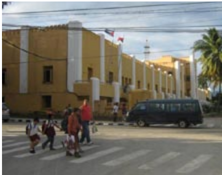
Figura 3. Sitio histórico Cuartel Moncada. Cortesía: Luís A. Fabars, 2010.

22. CASTELLANOS PALLEROLS, GRACIELA M a . “Modelo de Diseño de Estrategias para la Comercialización en Hoteles en el Polo Turístico de Santiago de Cuba”. Tesis doctoral. Facultad de Ciencias Económicas y Empresariales, Universidad de Valencia, Valencia, 2000. p. 14.