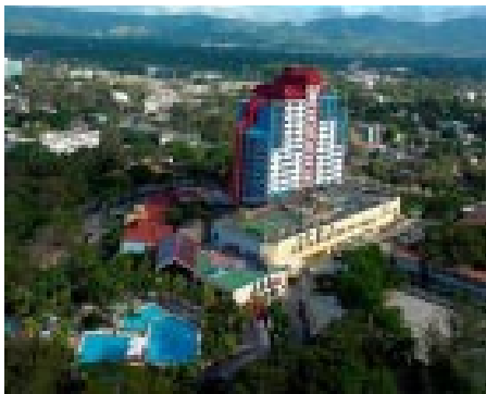
Figura 6. Equipamiento para convenciones hotel Meliá. Santiago. Cortesía: Oficina del Conservador de la Ciudad, diciembre de 2008.