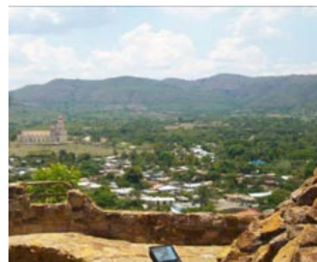
Figura 12. La Ruta del Esclavo Cimarrón en el Caribe. Cortesía Dr. C. Arq. Norka Cebrales. mayo de 2011.