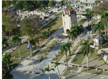
Figura 4. Cementerio Santa Ifigenia. Cortesía: Oficina del Conservador de la Ciudad, diciembre de 2008.