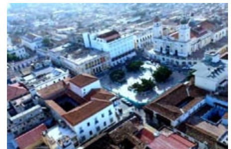
Figura 8. Parque Céspedes, espacio urbano de alto valor histórico y ricas tradiciones culturales, sitio fundacional de la ciudad. Cortesía: Oficina del Conservador de la Ciudad, diciembre de 2008.

Entre los problemas sociales ocasionados por la actividad turística asociados a la centralidad está la pérdida de espacios identitarios tradicionales de la población residente, por cuanto se ha asociado este sitio a la presencia