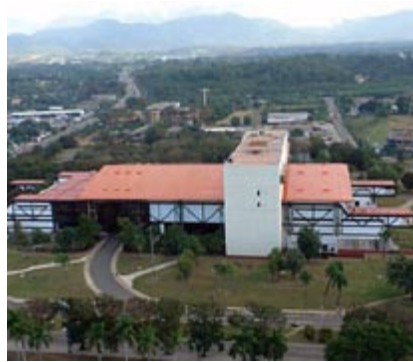
Figura 7. Equipamiento para congresos: Teatro Heredia. Cortesía: Oficina del Conservador de la Ciudad, diciembre de 2008.

En el desarrollo de la actividad turística es fundamental deducir aquellos elementos que inciden negativamente en las interacciones interpersonales y en la utilización que hacen los turistas de la ciudad. Entre dichos aspectos se encuentra el hecho del comportamiento de la centralidad, la cual como fenómeno sociofuncional tuvo su origen desde el propio surgimiento de la ciudad, lo que le concede a la parte más antigua de la localidad un alto valor histórico y de ricas tradiciones culturales que contribuye a que sus moradores se apropien del mismo y lo identifiquen como suyo (figura 8).