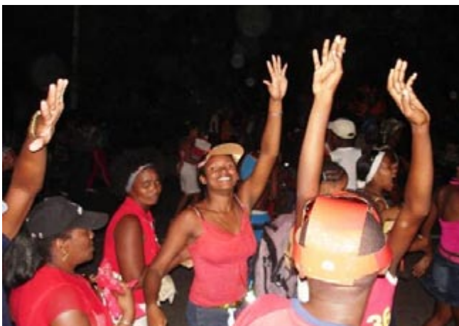
Figura 2. Ferias, fiestas y eventos deportivos; la población como recurso cultural relevante. Figura cortesía: Dr.C. Arq. Fernando Sánchez Rodríguez. 26 de abril de 2007.