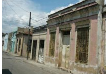
Figura 10. Fuerte deterioro del centro histórico. Fecha: marzo de 2004.

Entre los problemas de gestión del producto turístico están las deficientes conexiones nacionales, aéreas con otros polos turísticos del país y altos precios de los boletos aéreos nacionales; escasa elaboración de productos culturales por problemas de variedad, calidad y estabilidad de la programación cultural; gran concentración de visitas sobre pocos recursos culturales; el centro de la ciudad con gestión inadecuada de visitas; mal estado e insuficiencia de las infraestructuras de transporte, parque automotor y la accesibilidad; oferta limitada de algunos proveedores con precios elevados, baja calidad e inestabilidad en los suministros. [25]