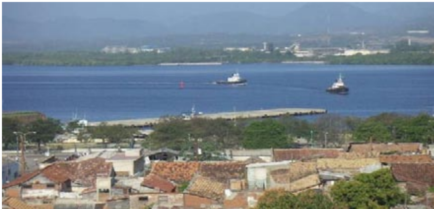
Figura 1. Majestuosos paisajes en la ciudad y su entorno inmediato. Foto cortesía: DrC. Arq. Roberto Rodríguez Valdés. 17 de febrero de 2006.

Las tablas que se presentan a continuación responden a la propuesta de variables especificada; La ciudad conserva edificios y espacios urbanos que constituyen atractivos históricos y culturales tangibles. (Ver tabla 1).