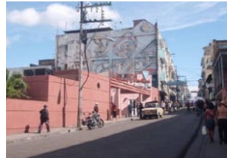
Figura 5. Recursos histórico-artísticos existentes en la ciudad. Cortesía: Luís A. Fabars, mayo de 2010.