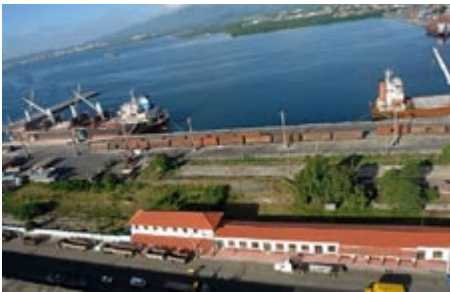
Figura 9. Recursos náuticos no aprovechados en la zona de la bahía. Fecha: diciembre de 2008.

Se ha definido la aportación de la estructura funcional de la ciudad en las insuficiencias del desarrollo del turismo ciudadano: fuerte deterioro del centro histórico por sobrecarga y antigüedad, entre otras causas por ser el centro de servicios urbanos más importante; recursos náuticos no aprovechados en la zona de la bahía (ciudad de espaldas al mar), (figura 9); también afecta al turismo la débil vida nocturna; la falta de mantenimiento técnico de la zona de viviendas, con pérdida irreversible de valores patrimoniales (figura 10).