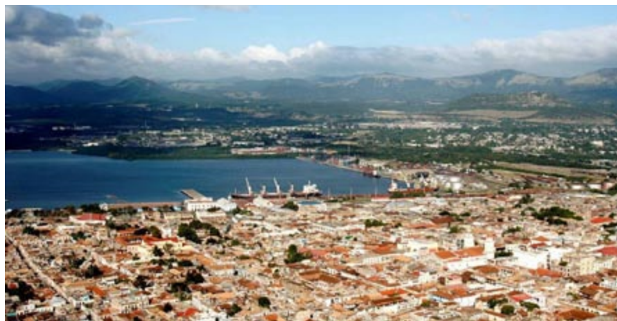
Vista aérea de la ciudad de Santiago de Cuba. Fecha: diciembre de 2008.