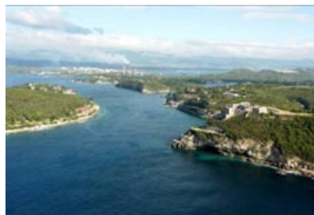
Figura 11. Sitio declarado Patrimonio de la Humanidad por la UNESCO: El Castillo San Pedro de la Roca y su sistema defensivo. Cortesía Oficina del Conservador de la Ciudad, diciembre de 2008.

Los alcances del estudio que se presenta son esencialmente de carácter teórico y contribuyen a la precisión de tres aspectos trascendentales en el turismo de ciudad: la pertinencia del empleo del recurso cultural como recurso turístico; la importancia de la población como actor principal en la conservación de recursos culturales urbanos y la necesidad de la