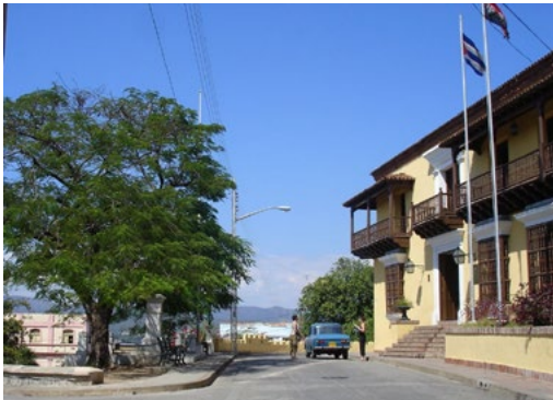
Figura 8. Conservación de recursos culturales, tangibles. Museo de la Clandestinidad, Santiago de Cuba. 4 de marzo de 2008. Autor Anónimo. Fuente: Fototeca del Diplomado de diseño, análisis y comunicación gráfica, Departamento de Arquitectura y Urbanismo, Facultad de Construcciones, Universidad de Oriente.

Otro principio considerado en la práctica internacional en la intervención en los sitios de valor es el Principio de la sustentabilidad de la identidad [32-34] como “elemento fundamental en la diferenciación y atraktividad, [...]” [35] centrando las estrategias y acciones promocionales en este criterio, tanto en lo social como en lo relativo a sitios urbanos, puesto que una alta afluencia de visitantes a la ciudad implica un impacto sobre estructuras físicas y sociales que puede modificar los atributos o atractivos de la misma, en interés del turista. La sustentabilidad de la identidad debe considerar la sustentabilidad ambiental y la capacidad de acogida cultural unidas a acciones de conservación de recursos culturales, tangibles e intangibles (figuras 8 y 9).