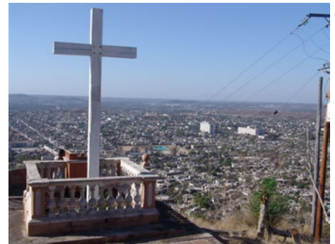
Figura 3. Interrelación de las ciudades patrimoniales con el medio físico natural de su entorno. Loma de la Cruz. 14 de abril de 2009. Autores: Eugenio Pastó y Carlos Fernández López. Fuente. Fototeca del diplomado de diseño, análisis y comunicación gráfica, Departamento de Arquitectura y Urbanismo, Facultad de Construcciones, Universidad de Oriente.

El planeamiento del desarrollo turístico en el turismo de ciudad también debe relacionarse con la minimización de impactos negativos sobre la cultura de la sociedad anfitriona, –llamada capacidad de acogida cultural–, evitándose la pérdida de tradiciones y manifestaciones culturales que signifiquen el deterioro de recursos culturales, tangibles o intangibles. El turismo puede ser “[...] percibido como un problema, pues provoca en numerosos destinos turísticos un cambio en la actitud de los individuos, indiferencia, una pérdida de valores morales y de solidaridad, una consolidación de la individualidad y en muchos casos hasta una pérdida de identidad.” [14]