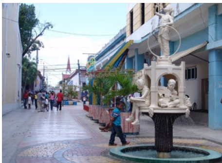
Figura 4. Los ingresos se revierten en la conservación y recuperación de elementos valiosos en interés de la población residente. Boulevard Guantánamo: 14 de abril de 2009. Autor Anónimo.

La sustentabilidad de la actividad turística también se alcanza logrando que parte de los ingresos obtenidos se reviertan en la conservación y recuperación de aquellos elementos valiosos, desde el punto de vista cultural y social, no solo en interés del turista, sino también de la población residente. (figura 4).