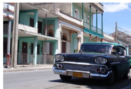
Figura 7. Centros históricos que por el mal estado que manifiestan han perdido atractivos. Guantánamo. Autor Anónimo. Fuente: Fototeca del Diplomado de diseño, análisis y comunicación gráfica, Departamento de Arquitectura y Urbanismo, Facultad de Construcciones, Universidad de Oriente.

Los autores estudiados enfocan, habitualmente, sus análisis en tres bloques temáticos: económico, funcional y sociocultural como los elementales. En lo sociocultural se destacan acciones vinculadas a los objetivos enunciados y que tienen puntos de contacto con el bloque temático funcional, esencialmente en lo relacionado con la diversificación funcional de los centros de servicio localizados en sitios históricos, la conservación de la función residencial y la subvención de la vivienda con servicios sociales que ocupen los mismos inmuebles. En este caso se resuelven tres aspectos: la garantía de la animación en las zonas centrales al mantener la actividad sostenida con la población residente, se evita la gentrificación 5 [29] y se resuelve el problema social de remediar las necesidades de vivienda a la población asentada en centros históricos, dadas las carestías acumuladas; se logra además un fuerte intercambio intercultural. Es trascendental que en los procesos de renovación y de refuncionalización 6 se promueva el respeto hacia el ser humano.