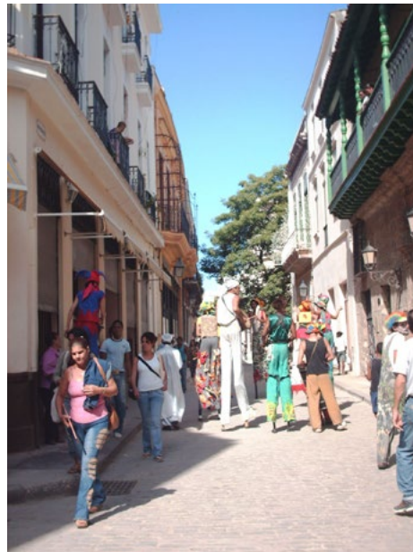
Figura 6. Conservación de sus tradiciones y de la ciudad en su conjunto. Habana Vieja. 18 de diciembre de 2006.