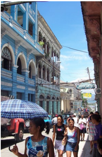
Figura 5. La población que habita la ciudad, su principal recurso. Población en la calle Enramadas, Santiago de Cuba.*