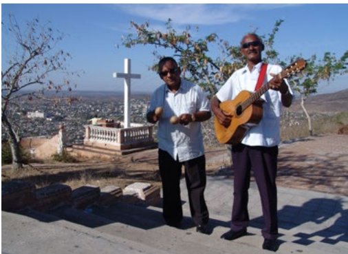
Figura 9. Conservación de recursos culturales intangibles. Cantantes, Loma de la Cruz, Holguín. 14 de abril de 2009.