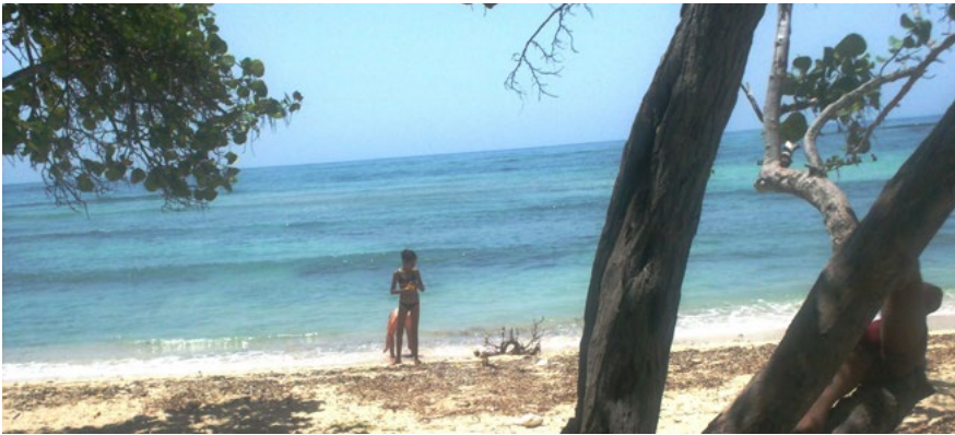
Figura 2. El medio físico natural del entorno urbano para fortalecer las opciones multidesestino y reducir la estacionalidad turística Playa. 8 de julio de 2008. Foto cortesía de Dra. Arq. Lourdes Rizo Aguilera. Fuente. Fototeca del diplomado de diseño, análisis y comunicación gráfica, Departamento de Arquitectura y Urbanismo, Facultad de Construcciones, Universidad de Oriente.