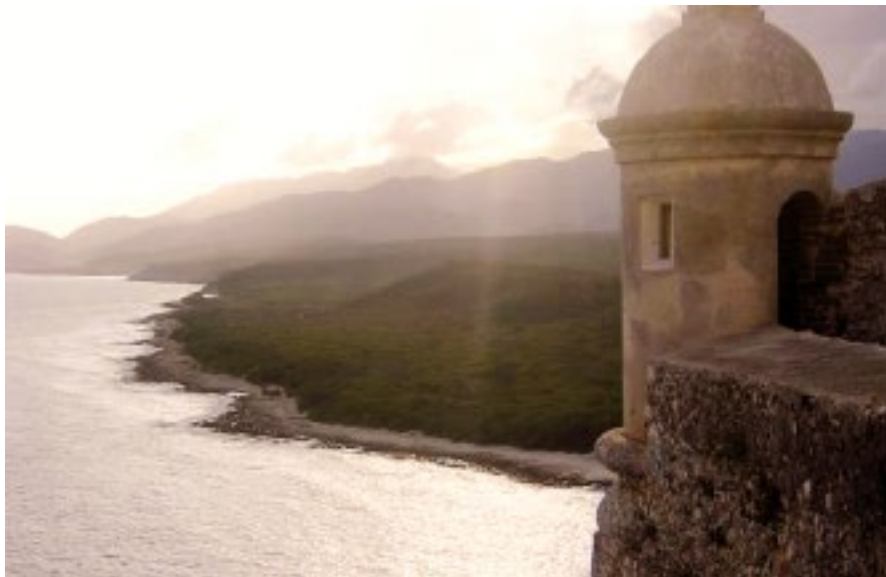
Atardecer en el Castillo San Pedro de la Roca, Santiago de Cuba. 11 de mayo de 2007.