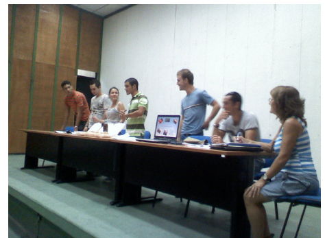
Figura 1 y 2. Trabajo de seminario en este caso de transculturación donde exponen, bailan, se disfrazan, dramatizan, juegos de roles y otros.