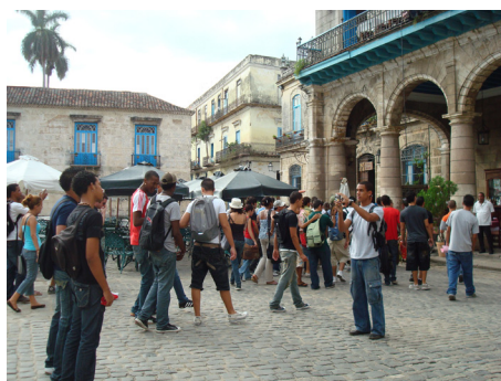
Figura 5 y 6: Los estudiantes están tomando fotos, videos, es decir trabajo independiente, por equipos e individuales para realizar sus evaluaciones, tanto de seminarios, como trabajo final.