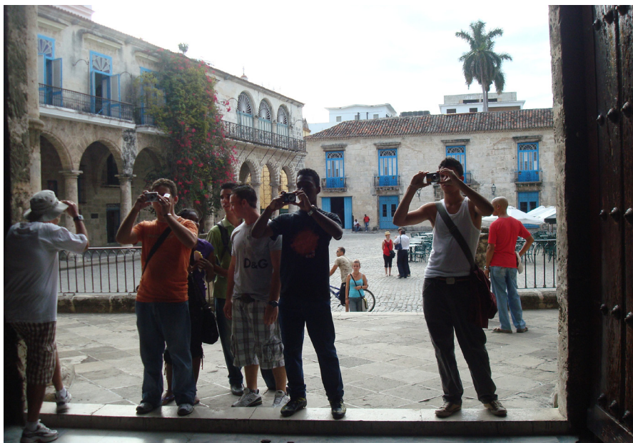
Figuras 3 y 4: La profesora con sus estudiantes en el recorrido por las plazas de La Habana Colonial.