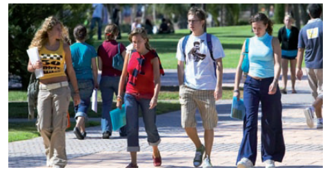
Figura 3. Alumnas y alumnos en los jardines del Campus de la Universidad de Alicante. Autor: Taller de Imagen, Gabinete de Imagen y Comunicación Gráfica de la UA. Fuente: Universidad de Alicante, http://web.ua.es/es/universidad-alicante/documentos/presentacion.pdf

En la composición del Personal de Administración y Servicios (PAS), se mantiene un equilibrio paritario, aunque las mujeres son mayoría. Sin