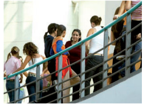
Figura 1. La universidad es un “espejismo de igualdad”, un espacio de barreras invisibles. Autor: Taller de Imagen, Gabinete de Imagen y Comunicación Gráfica de la UA. Fuente: Universidad de Alicante, http://web.ua.es/es/universidad-alicante/documentos/presentacion.pdf

Antes de titularse, los estudiantes de arquitectura pasan en la universidad un buen número de años [8], en una universidad que se convierte, para las mujeres, en un “espejismo de igualdad” (figura 1), porque las estudiantes de arquitectura ya son en número iguales o más que ellos y porque son académicamente mejores.