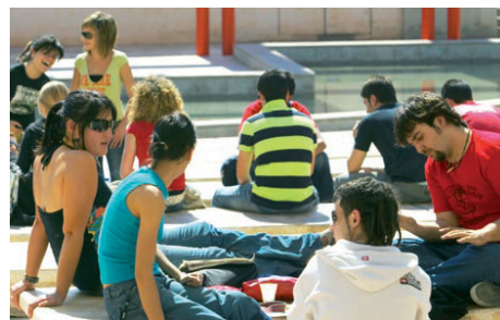
Figura 4. Alumnas y alumnos en el anfiteatro del Aulario II de la Universidad de Alicante. Autor: Taller de Imagen, Gabinete de Imagen y Comunicación Gráfica de la UA. Fuente: Universidad de Alicante, http://web.ua.es/es/universidad-alicante/documentos/presentacion.pdf

No obstante, cuando profundizan en la reflexión, se dan cuenta, con cierto asombro por no haberlo percibido hasta ese momento, de que el porcentaje de sus profesoras respecto a sus profesores no llega al 15 %. Valoran, por