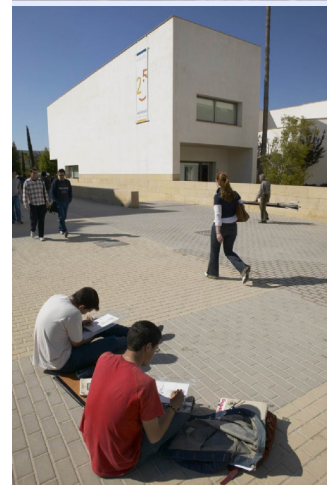
Figura 5. En la parte superior, Museo de la Universidad de Alicante, autor: Servicio de informática de la UA. En el centro y en la parte inferior, Edificio Germán Bernácer y Rectorado y Servicios Generales, respectivamente, autor: Roberto Ruíz Zafra. Fuente: Universidad de Alicante, http://aplicacionesua.cpd.ua.es/album/ua/default.asp?idioma=e

32. JAÉN i URBÁN, G. Guía de arquitectura de la provincia de Alicante . [en línea] Alicante: Instituto de Cultura Juan Gil-Albert, 1999. [Consulta: 2 de junio de 2012]. Disponible en: http://www.ua.es/personal/gaspar.jaen/ga/portada.htm