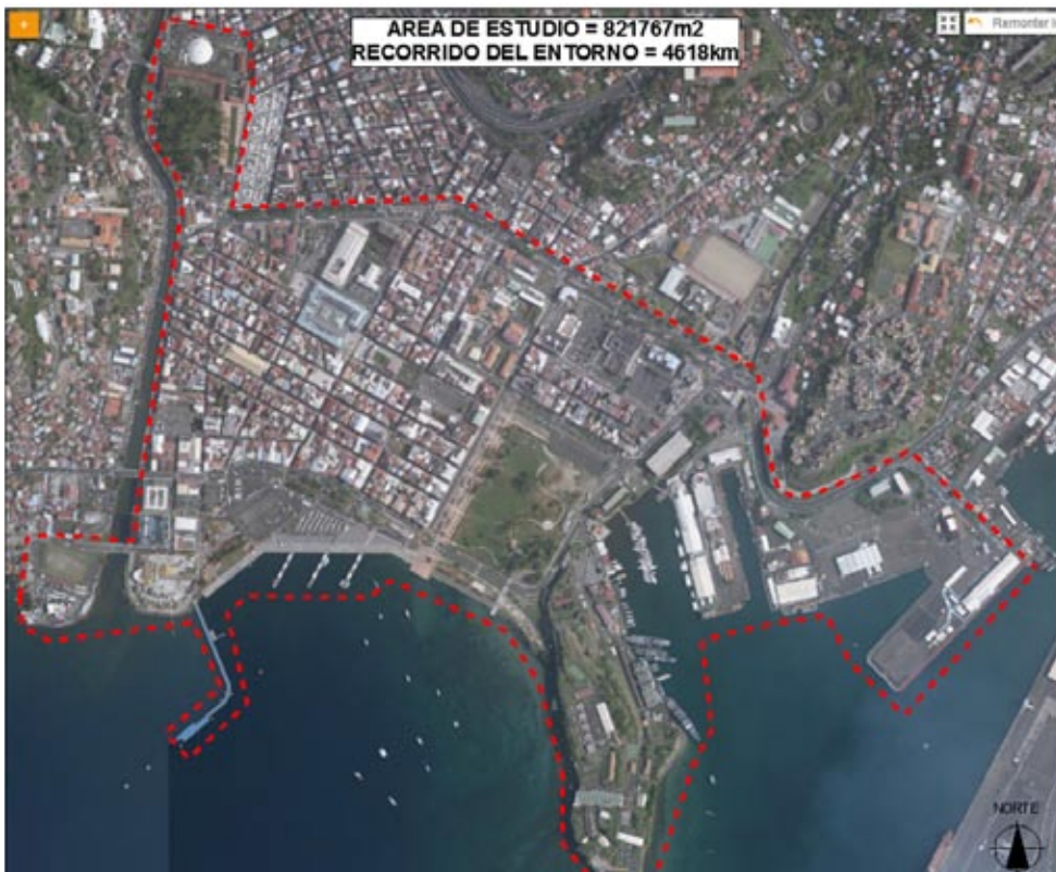
Figura 2: Delimitación del área de estudio