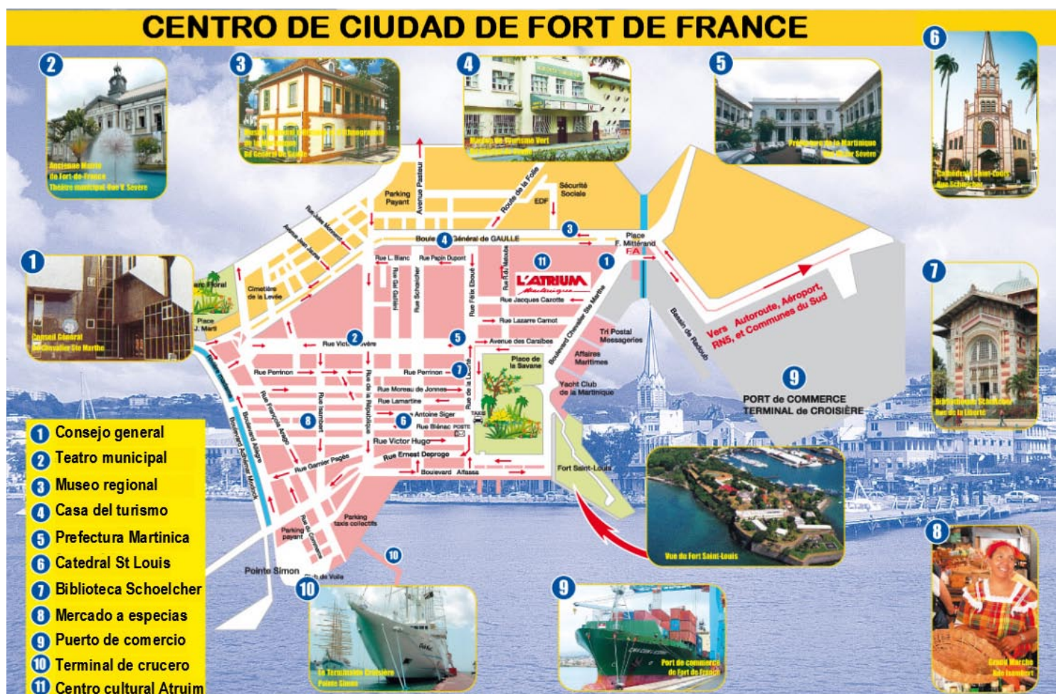
Figura 1: El centro de ciudad de Fort-de-France.

La ciudad de Fort-de-France y su centro, se configuran como un territorio de complejidad insular, en términos urbanísticos, arquitectónicos y funcionales (figura 1). Este centro es mucho más que un espacio urbano; es desde su origen, una ciudad heterogénea que requiere superar lecturas en exceso simplificadoras o focalizadas en los hitos de su patrimonio cultural y social, para enfrentar el reto de su configuración como destino turístico del Caribe.