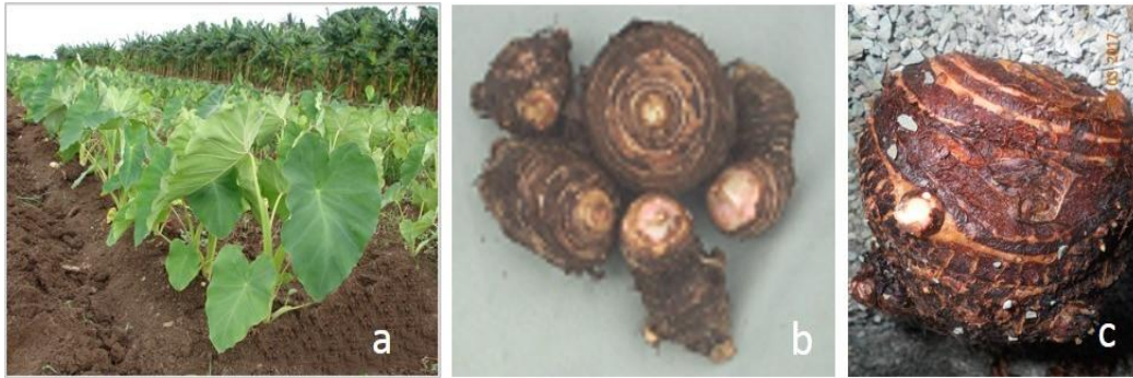
Figura 1. Plantas (a) y rizomas (b,c) de Colocasia esculenta cv. 'INIVIT MC-2012'.

En cada subcultivo (establecimiento y tres subcultivos de multiplicación) se cuantificó el número de explantes contaminados con bacterias (por observación visual de los recipientes de cultivo y comprobación de la presencia del grupo microbiano en observaciones directas al microscopio óptico, 400x y 1000x). Se calculó el porcentaje de contaminación bacteriana con respecto al total de explantes al inicio del subcultivo. Todos los explantes contaminados se eliminaron del proceso.