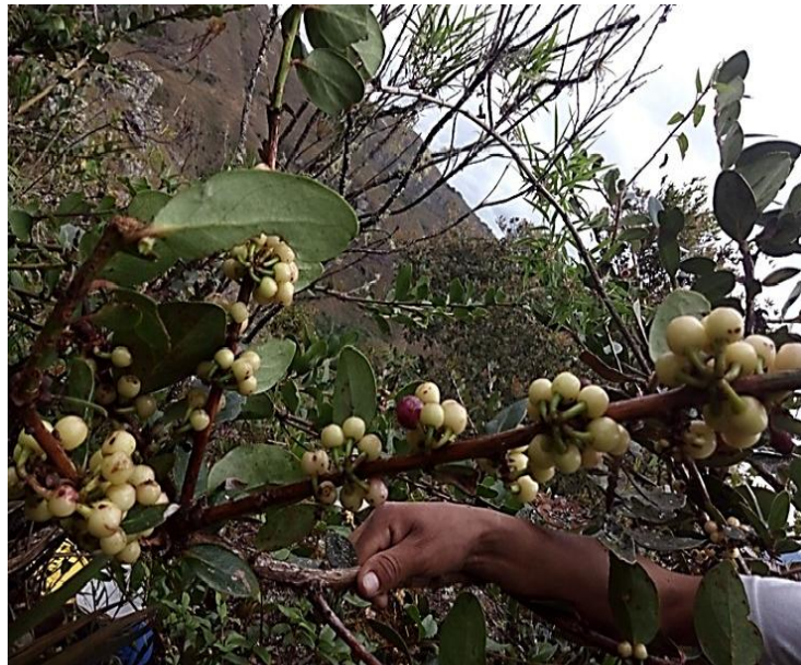
Figura 1. Planta de Macleania rupestris de donde se colectaron los frutos.

El estudio se llevó a cabo con plántulas in vitro de M. rupestris , existentes en el banco de germoplasma del Centro de Investigaciones en Recursos Genéticos, Biotecnología y Bioseguridad-CIRGEBB, de la Universidad Nacional Agraria La Molina. Estas se establecieron in vitro a partir de semillas de frutos maduros colectados a mano por habitantes del centro poblado de San Francisco perteneciente al Distrito de Conchán, provincia de Chota de la Región de Cajamarca (Figura 1).