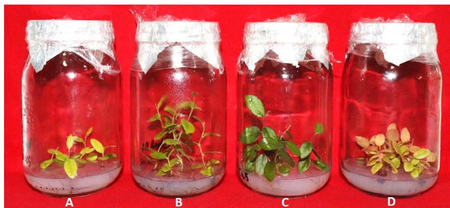
Figura 3. Plántulas in vitro de Macleania rupestris a los 120 días de cultivo. A (Medio de cultivo WP Control), B (Medio de cultivo B, WP+kinetina 1.0 mg l -1 ), C (Medio de cultivo A, WP+kinetina 0.5 mg l -1 ), D (Medio de cultivo CIRGEBB, WP+zeatina 0.5 mg l -1 ).

El efecto de kinetina como regulador de crecimiento observado en la presente investigación coincide con el descrito por Cantos et al. (2018) al estudiar su aplicación en el crecimiento de plántulas de Coffea arabica L. ( Rubiaceae ), al igual con resultados significativamente superiores. De igual forma, Smanhotto y Biasi (2019) utilizaron kinetina y zeatina como reguladores de crecimiento en la micropropagación de Vaccinium virgatum Ait ( Ericaceae ) y concluyeron que bajo las condiciones de su estudio, los tratamientos con zeatina mostraron mejores respuestas en comparación con un medio de cultivo base Woody Plant .