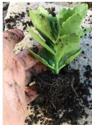
Figura 3. Plantas de Kalanchoe blossfeldiana Poelln obtenidas a partir de esquejes por macropropagación. (Izquierda) Supervivencia de las plantas, (Derecha) Planta formada a partir de un esqueje apical a los 90 días de cultivo.