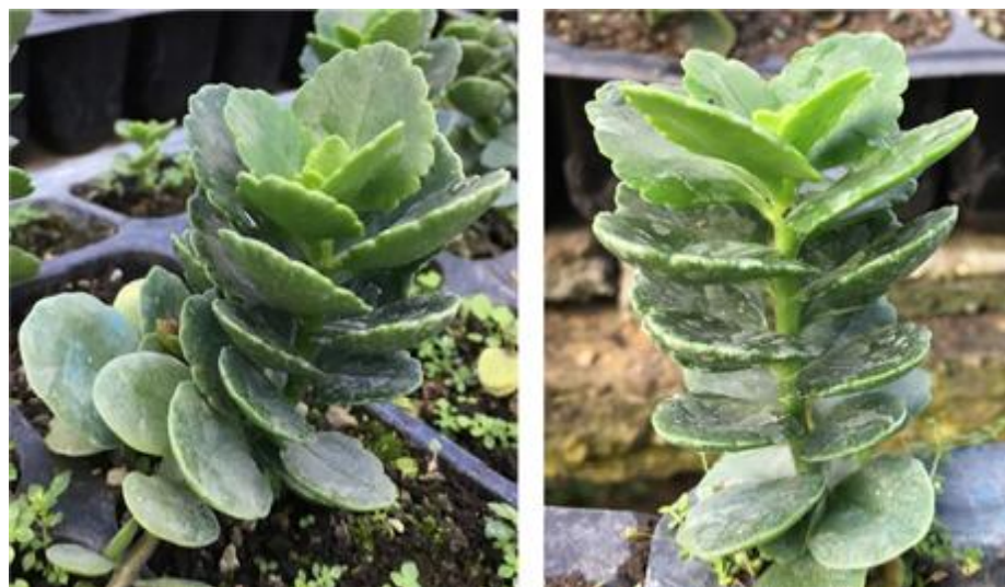
Figura 1. Plantas de Kalanchoe blossfeldiana Poelln. con características morfofisiológicas adecuadas para seleccionar como planta madre.

Los esquejes a utilizar serán: esquejes apicales (con 2 a 3 pares de hojas) y esqueje axilar que contenga un segmento de tallo con nudo y una yema (Figura 2).