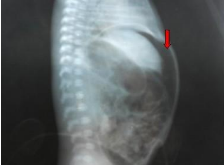
Fig. 2. Rayo x: abdomen simple vista lateral, acostado, aire libre en cavidad abdominal

Se interconsultó con Cirugía Pediátrica y se decidió realizar tratamiento conservador, por las características del paciente: su edad, peso y estado crítico. El tratamiento consistió en drenar la cavidad abdominal con dos drenes de buen calibre para evacuar aire y contenido peritoneal, suspender la vía oral y seguimiento las primeras 24 h con estudios radiográficos seriados cada seis horas.