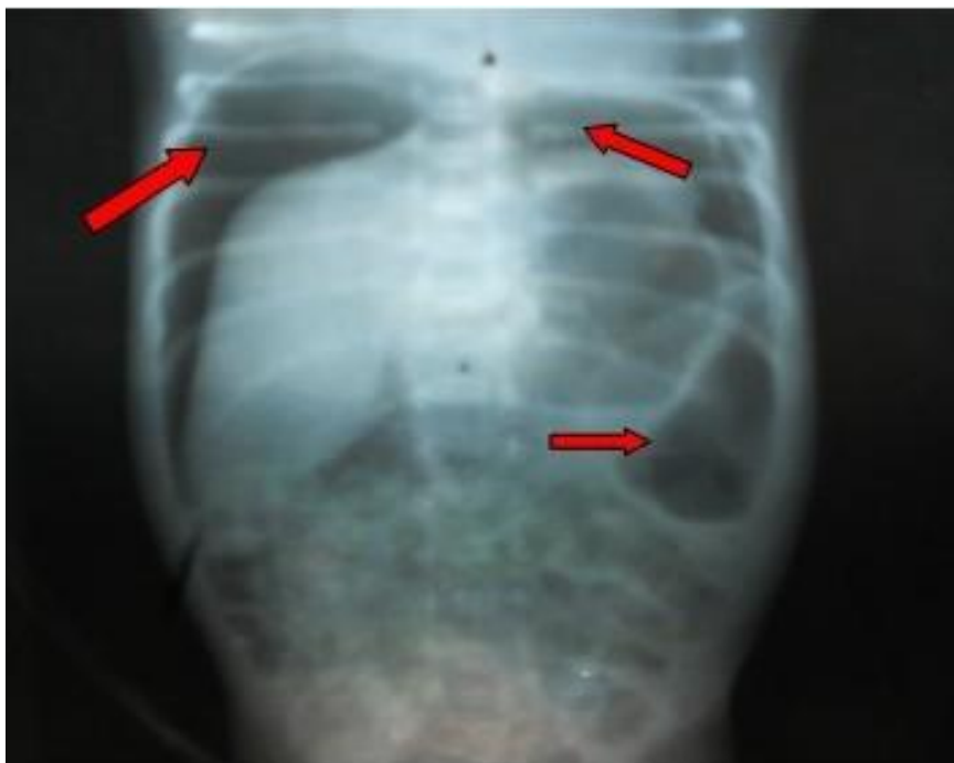
Fig. 1. Rayo x: abdomen simple vista anteroposterior de pie. Aire libre en cavidad abdominal

A las 25 h de edad se inició alimentación enteral mínima, evolucionó de forma favorable hasta las 50 h de edad que presentó abdomen globuloso, distendido, brillante, que impresionó doloroso a la palpación, con deterioro importante de su estado general. Se realizó radiografía simple de abdomen, con tres vistas ( fig.1 ) y se observó radiotransparencia en abdomen que se corresponde con aire libre en cavidad abdominal por neumoperitoneo( fig.2 ), se diagnosticó perforación intestinal espontánea.