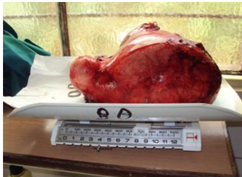
Fig.1. La muestra durante el pesaje

Por la clínica y por ultrasonografía se diagnosticó un mioma subseroso, por lo que se decidió, según la sintomatología de la paciente, el tratamiento quirúrgico. Se realizó histerectomía total abdominal. De esta intervención quirúrgica se obtuvo como resultado una pieza tumoral correspondiente a un mioma uterino con un peso de 4,7 Kg ( fig. 1 ).