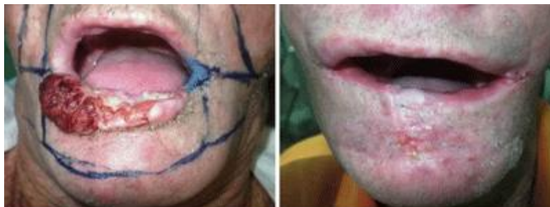
Fig. 4. Imagen preoperatoria y post-operatoria del paciente 3

El reporte histopatológico informó un carcinoma espinocelular infiltrante moderadamente diferenciado, T3N0M0, estadio III.