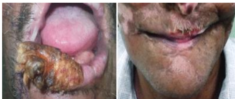
Fig. 3. Imagen preoperatoria y post-operatoria del paciente 2

Al reporte histopatológico se evidenció un carcinoma espinocelular infiltrante bien diferenciado y adenopatías sin metástasis, T3N0M0, estadio 3 .