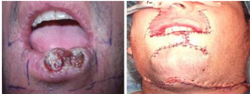
Fig. 2 . Imagen preoperatoria y post-operatoria del paciente 1

El reporte histopatológico informa un CCE invasivo bien diferenciado, con un tamaño del tumor de 37 mm (T2), sin adenopatías metastásicas (N0).La pieza quirúrgica presenta bordes libres de lesión, T2N0M0. Estadio II.