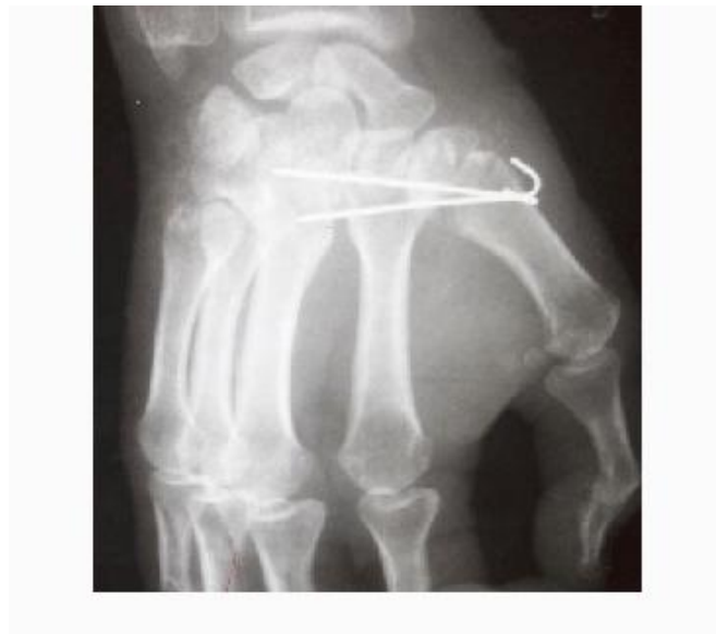
Fig. 2. Artrodesis trapecio metacarpiana (postoperatorio)