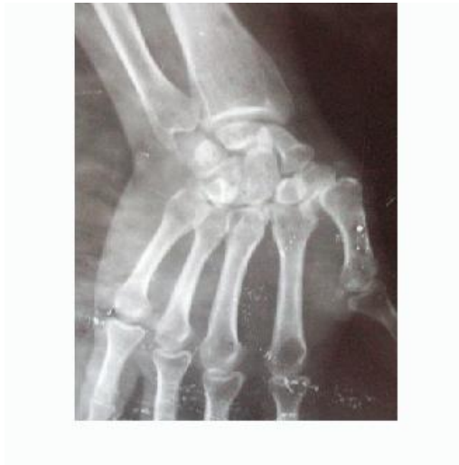
Fig.1. Luxación carpometacarpiana (preoperatoria)