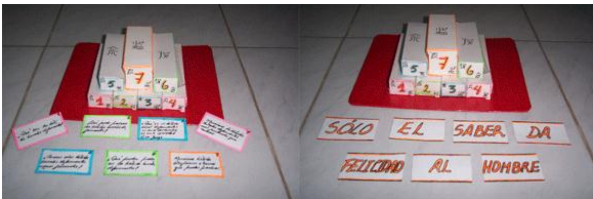
Fig. 2. La caja china

Tema 2: Sabe más quien pesca más ( fig. 3 ).