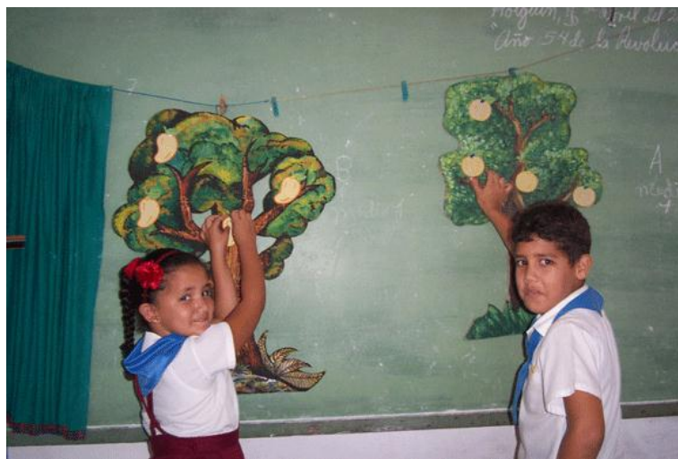
Fig. 5. El árbol del saber