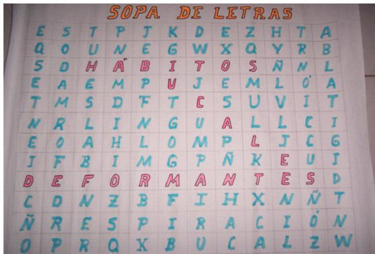
Fig. 4. Proyectando el futuro

Tema 3. Proyectando el futuro ( fig. 4 ) y el árbol del saber ( fig. 5 ).