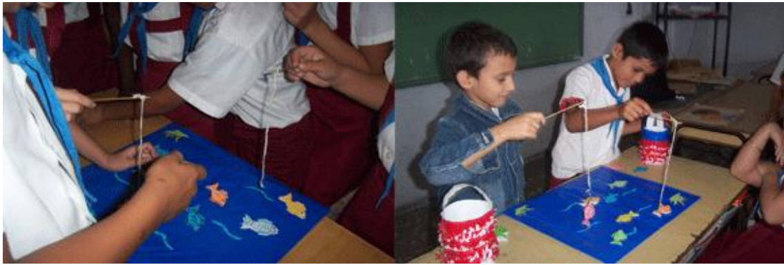
Fig. 3. Sabe más quien pesca más

Tema 3. Proyectando el futuro ( fig. 4 ) y el árbol del saber ( fig. 5 ).