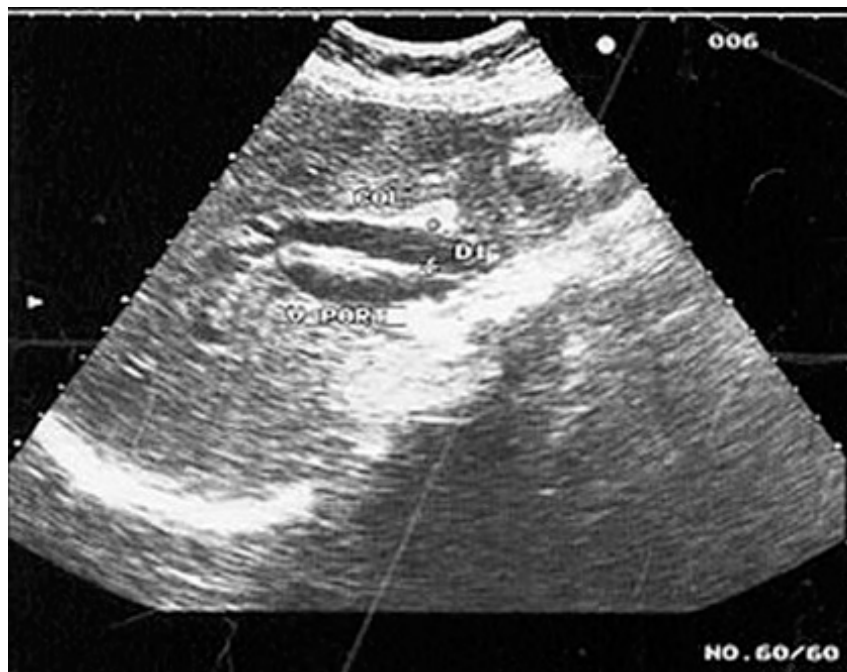
Fig. 1. Imagen ecográfica donde existe dilatación de la vía biliar extrahepática

Teniendo en cuenta que el tiempo de protrombina estaba prolongado, las heces acólicas y la dilatación de las vías biliares se decidió administrar vitamina K (25 mg) 1 ampula intramuscular cada 8 h por 24 h y repetir el coagulograma completo, donde se observó normalización del tiempo de protrombina; se repitió el hepatograma que mostró los siguientes valores: