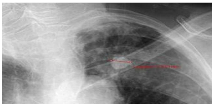
Fig 1. Radiografía computadorizada de tórax que muestra área radiopaca redondeada de bordes bien delimitados y de mayor densidad calcificada, de 10,39 mm, con las características de un NS en paciente femenina de 52 años

A partir del uso de estas herramientas de imagen se pudo extrapolar la diferenciación imagenológica de los nódulos sólidos (fig. 1).