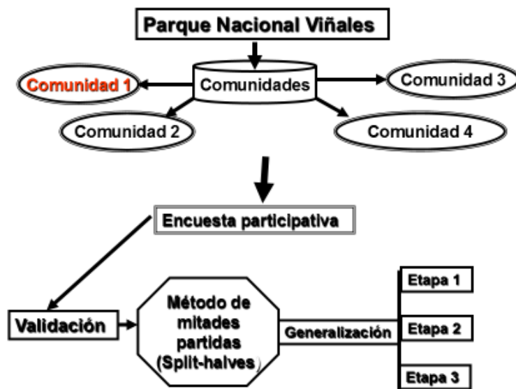
Fig. 1. Formato para comprobar la confiabilidad de la encuesta en las comunidades amazónicas.

La etapa de generalización consiste en aplicar toda la encuesta en dos momentos (Véase anexo), además de una entrevista estructurada (fase III), que propone la técnica Interlocutor-Medio-Interlocutor y considera la construcción de mensajes e información a través del diálogo que permite consultar al interlocutor especializado los contenidos de carácter científico y con el interlocutor destinatario los códigos y formas verbales, así como los contenidos, el orden y el nivel, además del momento más oportuno para compartir el mensaje. Se podrán realizar entre 13 a 15 visitas al área por un período de cinco días semanales. Durante las visitas a las comunidades se obtendrá información teniendo en cuenta: experiencia, cultura relativa al objeto de estudio y prácticas tradicionales, por lo que debe ser masiva