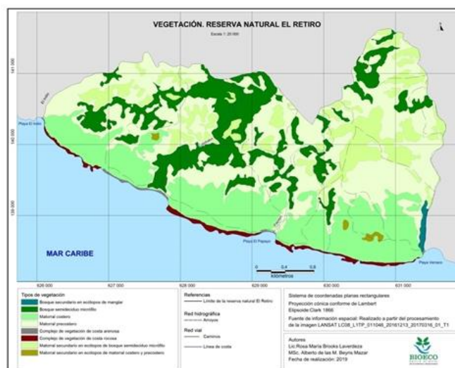
Figura 2. - Vegetación en la Reserva Natural El Retiro

Se obtuvo un mapa de vegetación donde se distinguen siete tipos de vegetación 1:2500 (Figura 2): bosque semidecídulo micrófilo, bosque secundario en ecótopos de manglar, matorral costero y precostero, matorral secundario en ecótopos de bosque semidecídulo micrófilo, matorral secundario en ecótopos de matorral costero y precostero, complejo de vegetación de costa rocosa y complejo de vegetación de costa arenosa. Predomina en extensión el matorral costero y precostero, el cual se puede diferenciar en matorral costero y matorral precostero, le sigue en extensión el bosque semidecídulo micrófilo.