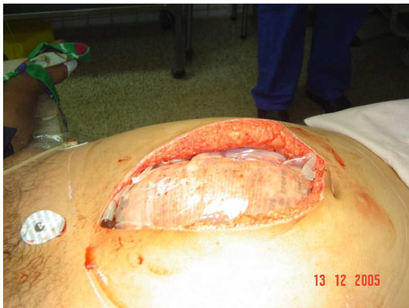
Figura 1. Cierre temporal del abdomen con Bolsa de Bogotá.

La contaminación se controla igualmente con técnicas de salvamento: ligaduras y suturas mecánicas, sin perder tiempo en anastomosis ni en ostomías. El cierre del abdomen es temporal y la técnica que ese utilice depende del equipo quirúrgico, por lo que varía desde la aplicación de pinzas de campo en la pared hasta el empleo de la «Bolsa de Bogotá» (mediante el uso de las bolsas estériles recolectoras de orina). El objetivo es prevenir el síndrome compartimental abdominal. 38-40 Morris encontró que esta complicación se presentaba en 28 % de los pacientes sometidos a laparotomía por cirugía de control de daños y que tenía una mortalidad subsiguiente de 62,5 %. 41 La Bolsa de Bogotá constituye la forma más económica y eficiente para proteger las vísceras a corto plazo. 42 Además, se ha descrito el empleo del vacuum pack (cierre al vacío con colocación de bolsa plástica sobre las vísceras y paños quirúrgicos estériles con drenajes en aspiración, todo ello sellado con un apósito plástico adhesivo (figura 1). 43