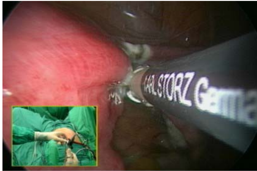
Fig. 1. Disección mediante el uso de la electrocoagulación bipolar y tijera, alternando la entrada a la cavidad por el canal de trabajo del laparoscopio.

aspira la cavidad. Se extrae el trócar, previa desuflación con evacuación del CO 2 . Por último, se cierra la aponeurosis umbilical y la incisión de piel.