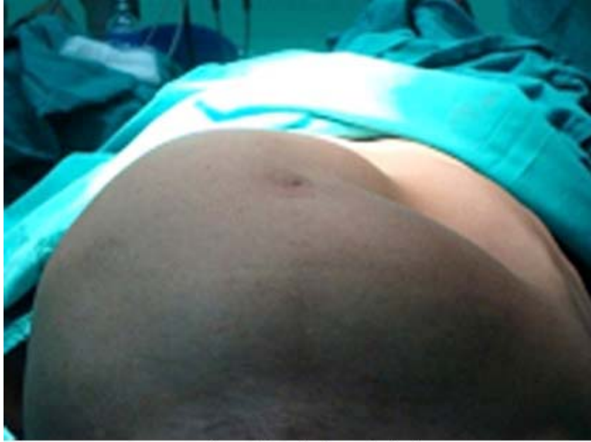
Fig. 1. Gran tumoración abdominal asimétrica.