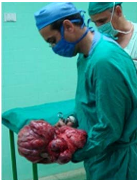
Fig. 5. Pieza quirúrgica de 3 800 g.

Biopsia de la pieza quirúrgica: Sarcoma del estroma prostático de bajo grado de 33 × 23 × 11 cm y 3 800 g.