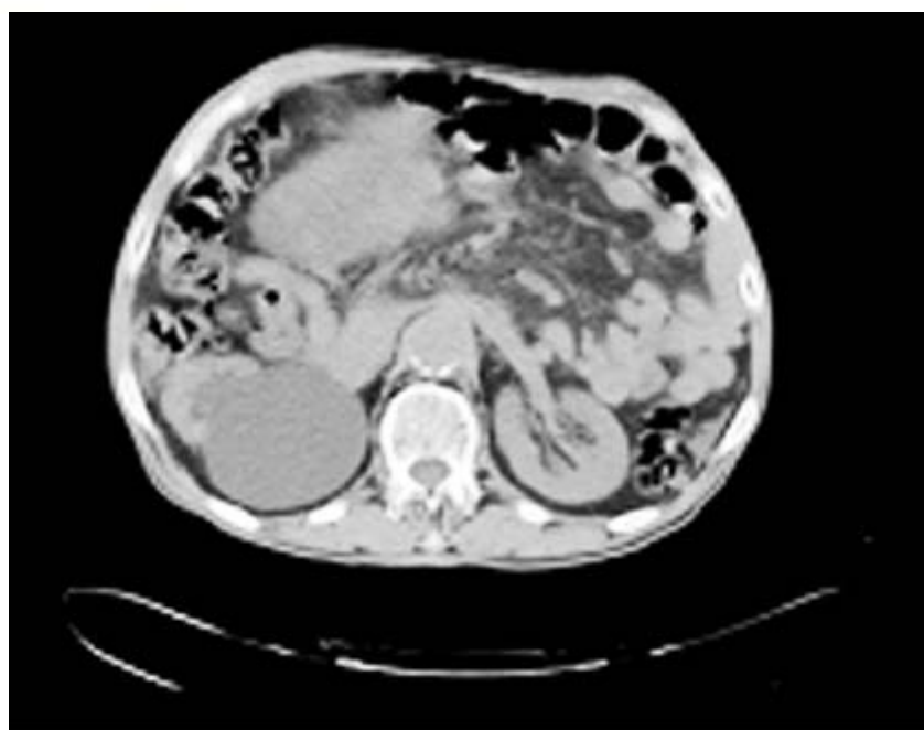
Fig. 3. Desplazamiento de las asas intestinales y compromete el uréter derecho, provocando hidronefrosis.