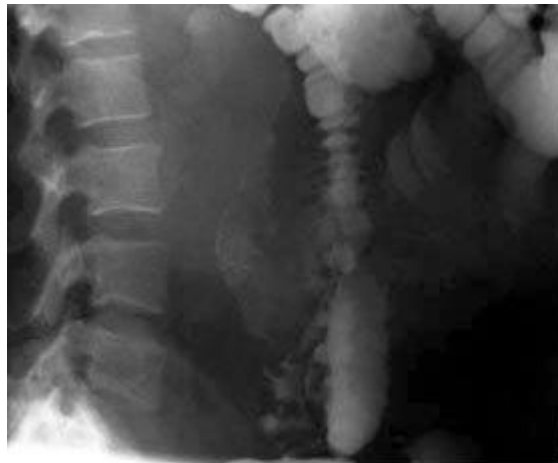
Fig. 1. Colon baritado oblicuo.

Se efectúa estudio contrastado de colon con bario (Fig. 1 y 2) donde se aprecian varios divertículos en colon sigmoides y una gran imagen de defecto de lleno que crea un desfiladero a nivel del colon sigmoides, con crecimiento posterior y extravasación de contraste.