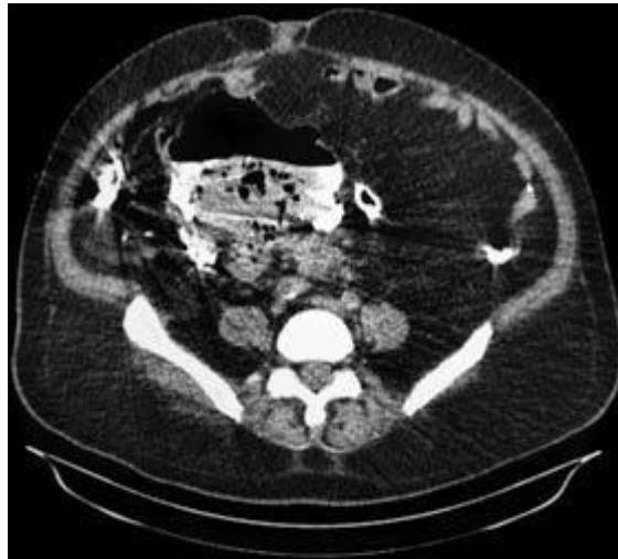
Fig. 3. Tomografía axial con gran divertículo.

Posteriormente se realiza una tomografía axial simple del abdomen y se concluye como un divertículo gigante de colon sigmoides perforado (Fig. 3).