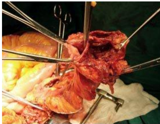
Fig. 4. Luz intestinal y pared diverticular perforada.

El Paciente es intervenido quirúrgicamente de urgencia y se confirma la presencia de una extensa área de aproximadamente 20 cm. de colon sigmoides perforada, constituida por un área diverticular extensa, necrosada, con abundantes coágulos y materia fecal líquida. Esta crece a través del mesenterio hacia el retroperitoneo. Mantiene contenida la perforación y su contenido (Fig. 4).