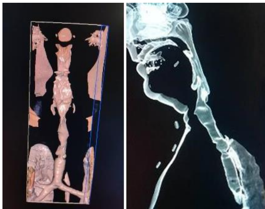
Fig. 1- Reconstrucción multiplano donde se observa área estenótica traqueal.

Se realiza una tomografía axial computarizada (TAC) simple de cuello y tórax con reconstrucción multiplano constatando fibrosis pulmonar a nivel de los campos pulmonares superiores asociado a imágenes en panal de abeja periféricas, compatibles con bronquiectasia; engrosamiento pleural bilateral acentuado en el lado derecho; estenosis del 1/3 medio de la tráquea de 3 cm en cuello de botella con imagen hiperdensa de aproximadamente 7 mm a nivel del bronquio superior derecho en su parte proximal (fig. 1).