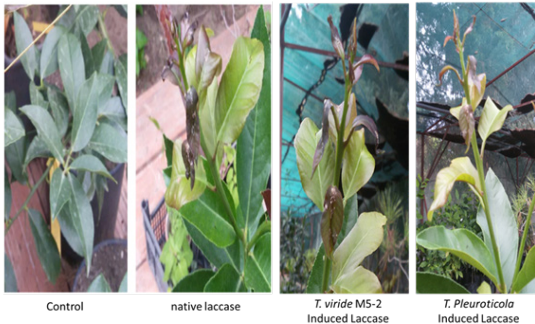
Figure 2. Foliar lignolytic capacity of C. kusanoi L7 laccases at 24 h of treatment