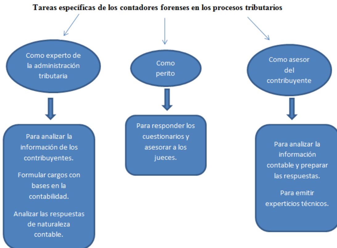
Figura 2. Papel de los contadores forenses en procesos tributarios.