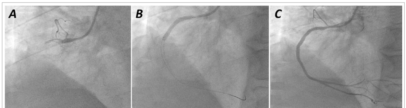
Figura 2. A. Proyección angiográfica oblicua anterior izquierda de 30° donde se visualiza la oclusión total proximal de la coronaria derecha. B. Implantación del stent . C. Resultado angiográfico.

Es oportuno comentar que los SLF, pese a tener ventajas notables en relación a la aparición de trombosis, en comparación con los SMC, son igualmente susceptibles a la causa multifactorial. No obstante, es posible la asociación de nuevos factores relacionados, al tener en cuenta la relativa complejidad de estos dispositivos: plataforma metálica (material, geometría, grosos de filamentos), polímero (composición, disposición, grosor, biocompatibilidad, trombogenicidad, potencial proinflamatorio,