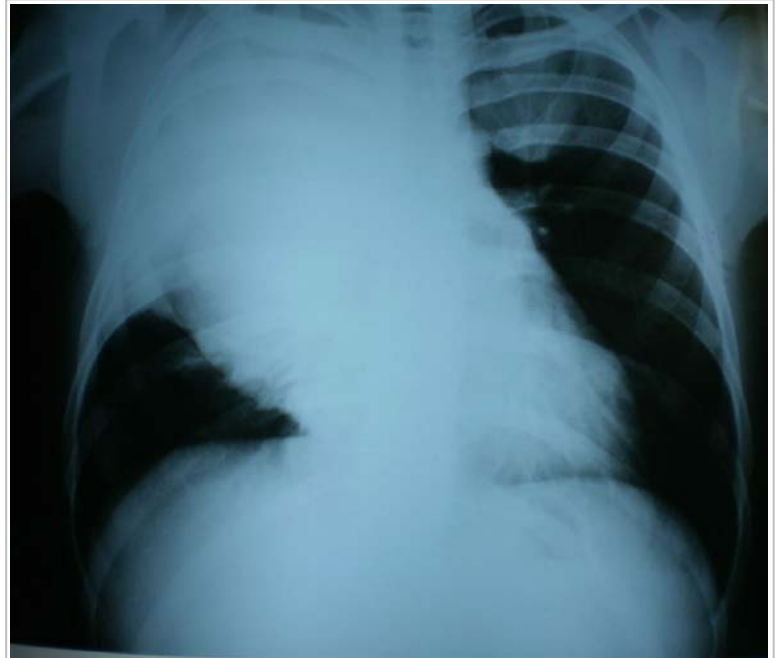
Figura 1. Radiografía preoperatoria posteroanterior de tórax.

Se presenta el caso de un varón de 19 años de edad, aparentemente saludable, que comenzó con decaimiento, febrícula vespertina, tos y pérdida de peso, agudizado en el último mes antes de su ingreso. La radiografía de tórax ( Figura 1 ) evidenció un ensanchamiento mediastínico importante, extendido al vértice del pulmón derecho y la tomografía axial computarizada, lesiones metastásicas en ambos pulmones. Ante la imposibilidad de realizar biopsia, se decidió comenzar tratamiento oncológico neoadyuvante. Apareció fiebre persistente y se inició tera-