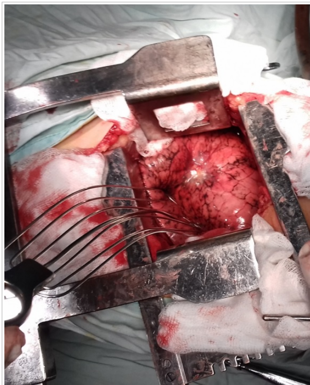
Fig. 4. Un estado óptimo de relajación muscular, el almohadillado de las costillas y la colocación de dos separadores costales, permite un amplio campo operatorio para acceder a prácticamente cualquier estructura intratorácica.

o dérmicos de mayor o menor extensión, que permiten la movilidad requerida para la retracción de los músculos 6 y facilitan una apertura mecánicamente menos traumática del espacio intercostal escogido para acceder a la cavidad torácica 7 . Así, la lógica parece señalar que el motivo por el cual la mayoría de las toracotomías axilares verticales han sido descritas en la vecindad de la línea media, radica en que la ventajosa realización de la incisión equidistante a la columna vertebral y al esternón, facilitaría el desarrollo de colgajos homogéneos en ambas direcciones.