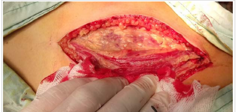
Fig. 2. El borde anterior del músculo dorsal ancho es empleado como marca anatómica, tanto para la incisión en piel como para el abordaje al espacio intercostal.

Un detalle técnico a destacar consiste en la importancia de hacer coincidir la colocación de los separadores costales y la abertura del campo quirúrgico con una óptima relajación muscular del paciente, lo cual requiere un trabajo coordinado con el anestesiólogo. Esta maniobra disminuye considerablemente la incidencia de fracturas costales y aunada a la habitual colocación de almohadillas de gaza sobre las partes óseas, también contribuye a evitar lesiones del paquete vasculo-nervioso subcostal ( Fig. 4 ).