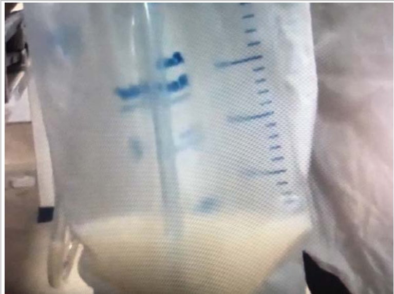
Fig. 2. Drenaje quiloso después del inicio de la alimentación oral, posterior a la revisión quirúrgica por sangrado.

acumulados en la parte posterior del corazón y alrededor de la vena cava superior y el tronco venoso innominado. Se encontró y reparó una fuga en la anastomosis proximal del injerto de safena y la operación se completó con lavado del área mediastínica y la colocación de un nuevo drenaje; por donde no se detectó sangrado significativo posterior.