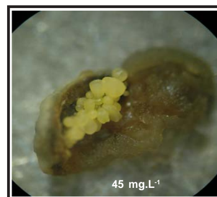
Figura 2. Formación de embriones somáticos a partir de cotiledones cigóticos inmaduros en el cultivar de soya INCASoy-27 a las cuatro semanas en medio de cultivo con ácido 2,4-D

En este experimento se observó la formación estratificada de embriones somáticos, dando origen a embriones somáticos secundarios, tanto en la superficie apical como basal de los embriones somáticos primarios, mediante un proceso conocido como embriogénesis somática repetitiva (Figura 3a).