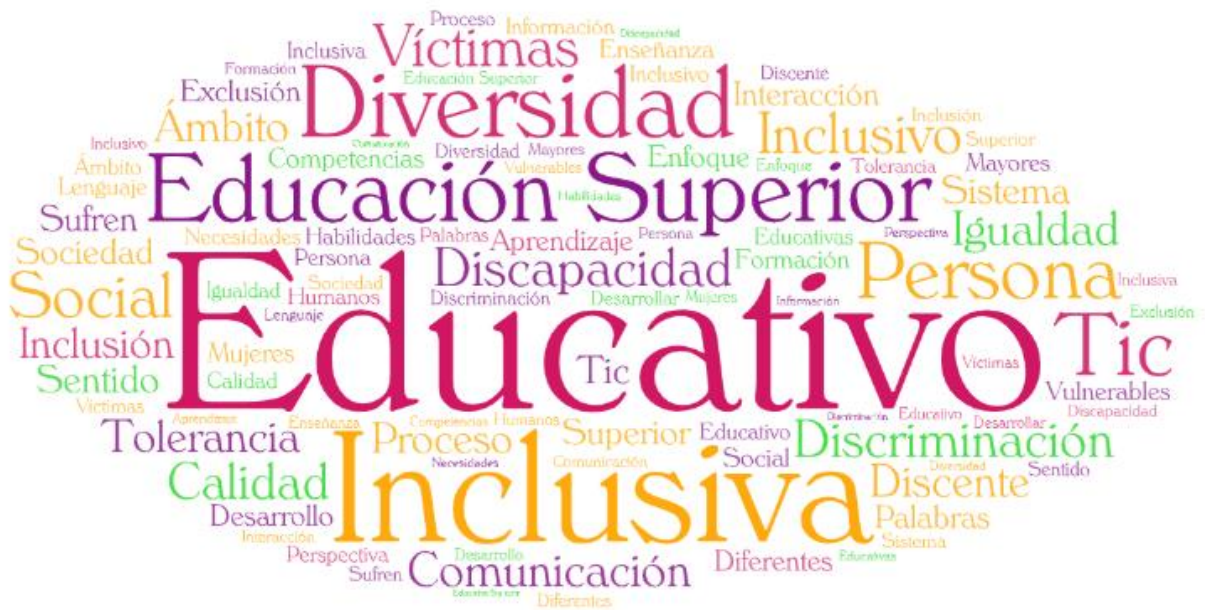
Figura 2: Palabras con mayor regularidad en la revisión documental