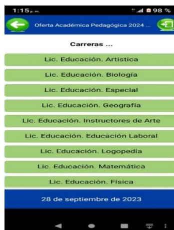
Figura 3. Pantalla con opciones de las carreras pedagógicas que se estudian en la UM Al seleccionar una de las carreras, aparecerán varias pantallas con información importante sobre la misma, como se comentó anteriormente.